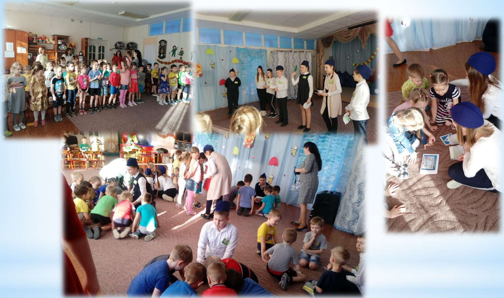
Отряд ЮИД «Светофор» школы № 4 побывал в гостях у ДОУ № 53. (17.02.2020 г.)