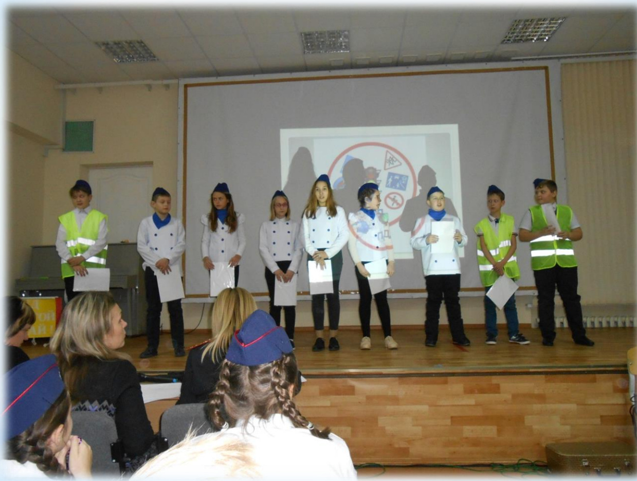
Смотр-конкурс агитбригад ЮИД (19.11.2019 г.)