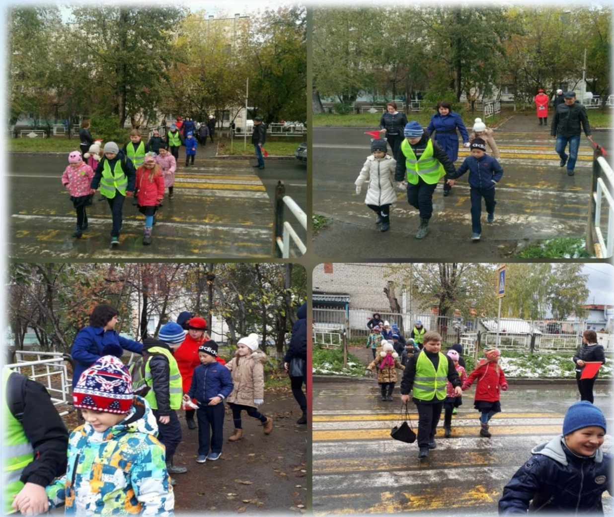
«Единый урок по безопасности дорожного движения для учащихся первых классов» (25 сентября 2019 г.)